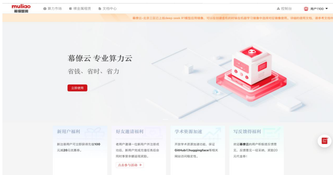
幕僚智算产品用户界面

提供多样化算力选择，满足不同规模和要求计算需求。用户可根据需求选择不同算力云套餐，实现按需使用、弹性扩展，显著降低计算成本。幕僚智算为人工智能和深度学习领域提供了强大的计算能力和资源支持，成为推动创新和应用的关键力量。