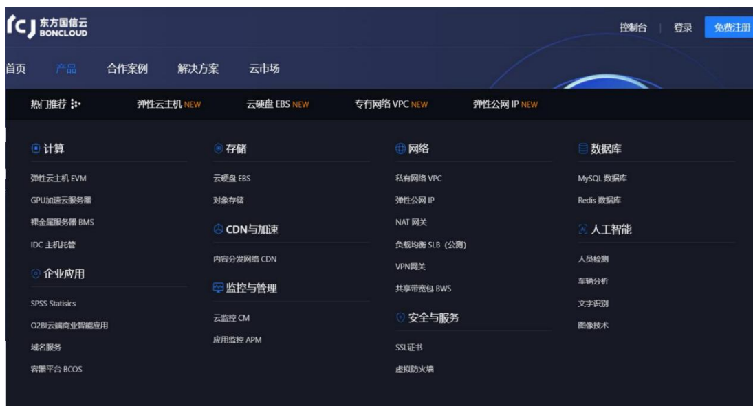
东方国信云产品矩阵

东方国信云计算业务 BONCLOUD 是依托东方国信多年的云计算技术研发和服务积累以及多年沉淀的丰富软件产品，结合优质数据中心资源，打造的云服务平台。公司结合 20 多年企业级 IT 及大数据服务经验，在工业互联网、政务、金融等企业级市场全面布局，可提供从服务器机柜租赁、裸金属到私有云、公有云、混合云等一体化、自动化、智能化的端到端交付解决方案。云业务实现全局的安全监测和预警，风险实时发现和威胁精确定位，保障系统和数据安全，专业服务上千家内外部客户。